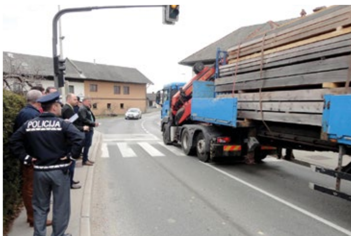
Gost promet na Kamniški cesti ogroža naše občane in znižuje kvaliteto bivanja. Obvoznica je za Vodičane prioriteta v letu 2019.