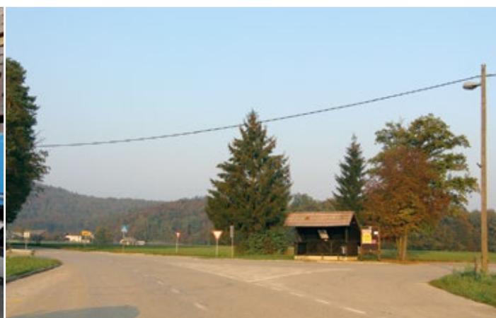
Križišče cest na Selu je eno od križišč v občini z neustrezno geometrijo. Predlagamo rekonstrukcijo tega križišča s preureditvijo v prvo (vzorčno) križišče v Občini Vodice.