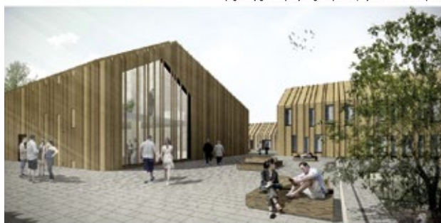
terasa - pogled iz knjižnice proti poslovnim, upravnim in zdravstvenim prostorom