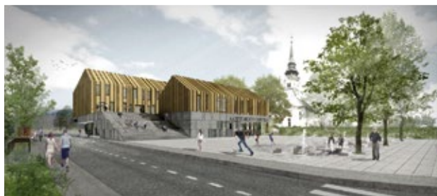
pogled iz juga na Kopitarjev trg s stopniščem, knjižnico in občinsko upravo