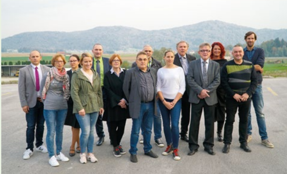
Kandidati Liste neodvisnih krajanov, ki bodo skrbeli za enakomeren razvoj vseh delov občine. V ozadju rašiško hribovje v jeseni.

Svobodomiselni, od političnih strank neodvisno razmišljajoči in odgovorni državljani smo Listo neodvisnih krajanov (LNK) ustanovili takoj ob nastanku Občine Vodice 1994 leta. Imamo najdaljši staž delovanja med neodvisnimi vodiškimi listami, sodelovali smo na vseh dosedanjih volitvah. Imenu liste in našim temeljnim idejam smo ostali zvesti v vseh 24 letih. Seveda smo z leti glede na rast oz. razvoj občine tudi dograjevali program dela in v listo vključevali nove strokovne osebe in mlajše kadre.