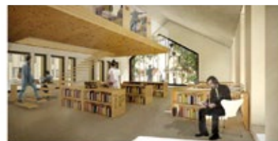
pogled iz knjižnice proti cerkvi sv. Marjete ter na teraso pred knjižnico