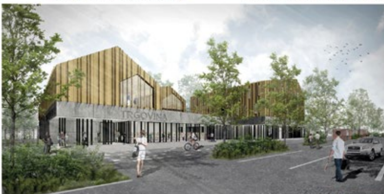
pogled s parkirišča na trgovino in lokale

vzemali za povezovanje v regionalne turistične organizacije, prek katerih bomo združili občinske ponudnike in med drugim povezali in spodbudili turistično dejavnost v naši občini.