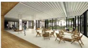
pogled iz večnamenske dvorane in info točke proti parku pod lipami